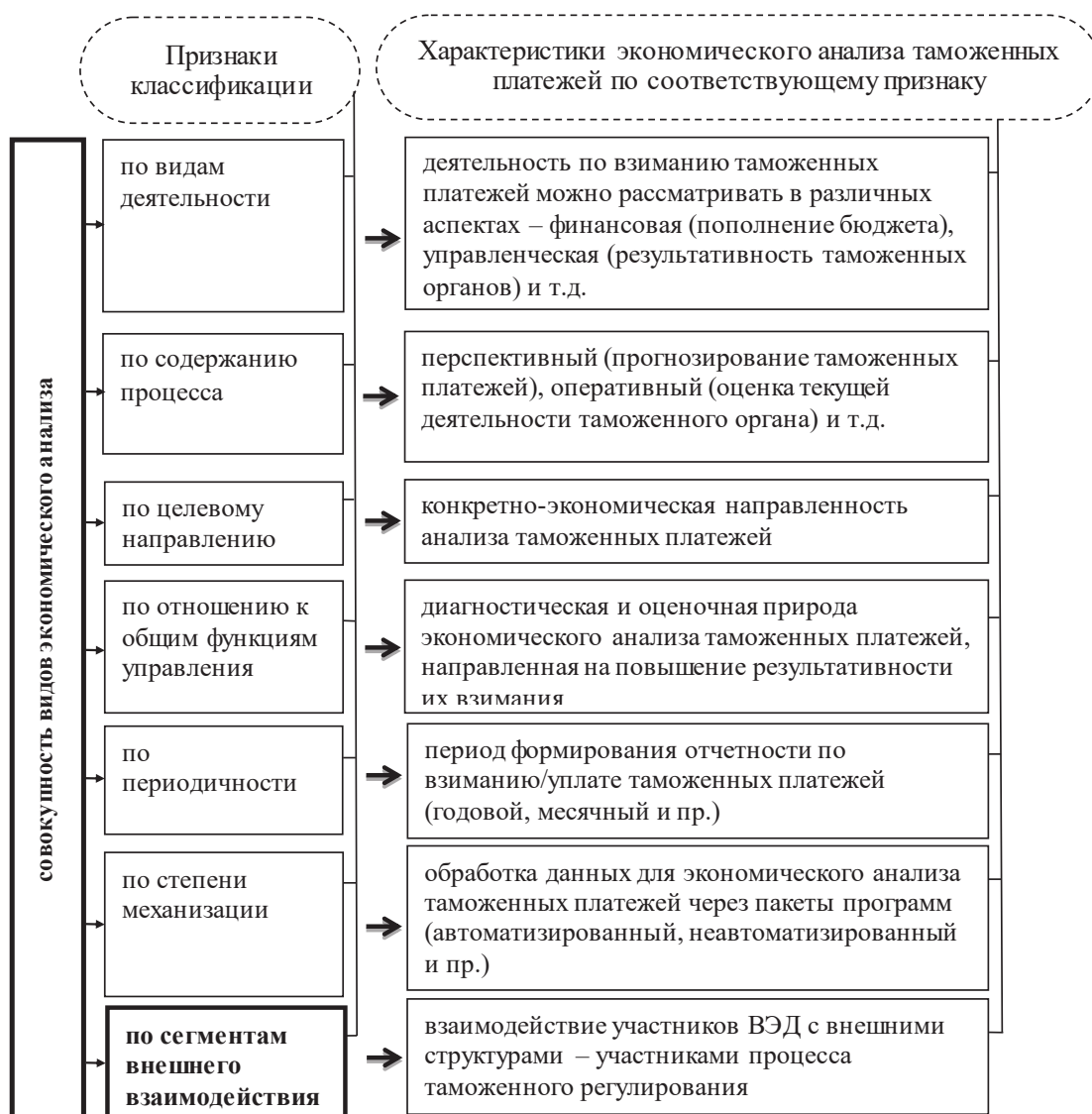
Рисунок 1. Дополнение признаков классификации и уточнение характеристик экономического анализа применительно к таможенным платежам

Сама формализованная модель проведения экономического анализа таможенных платежей отражена на рисунке 2.