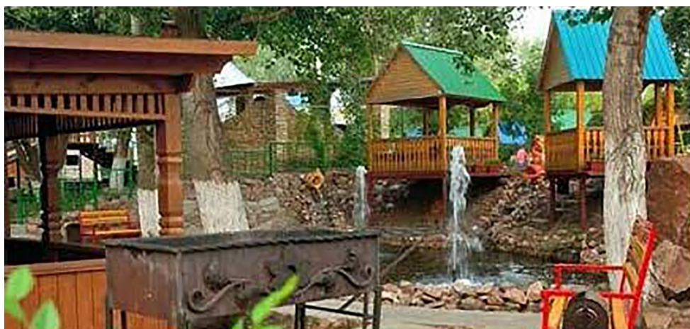
Рисунок 3. Зона отдыха