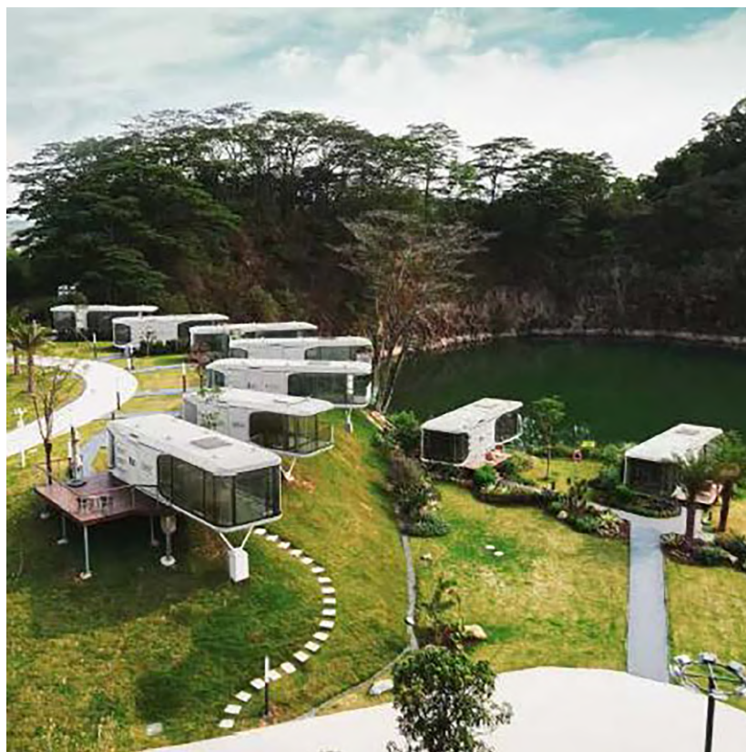
Рисунок 7. Перспективное изображение