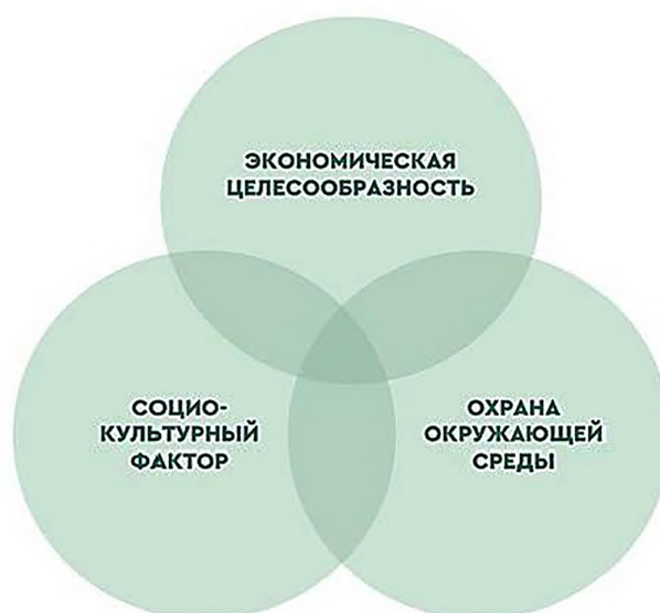
Рисунок 4. Концепция устойчивого развития