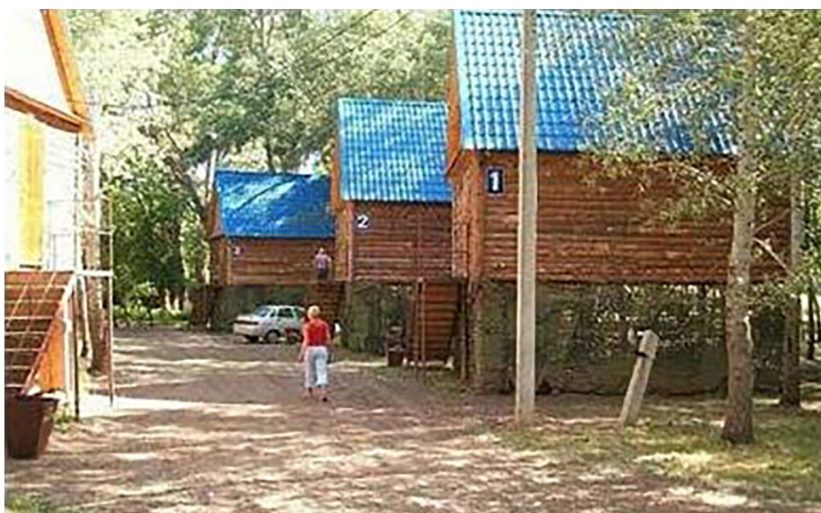
Рисунок 2. Жилой блок, туристическая база «Экстрим-Парк»