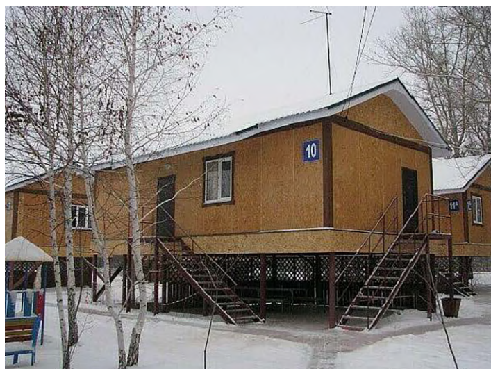
Рисунок 1. Жилой блок, туристическая база «Экстрим-Парк»