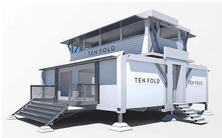
Рисунок 9. Перспективное изображение