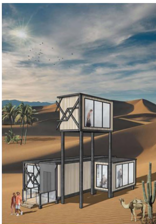
Рисунок 12. Перспективное изображение, отражающее вариант подъемных конструкций