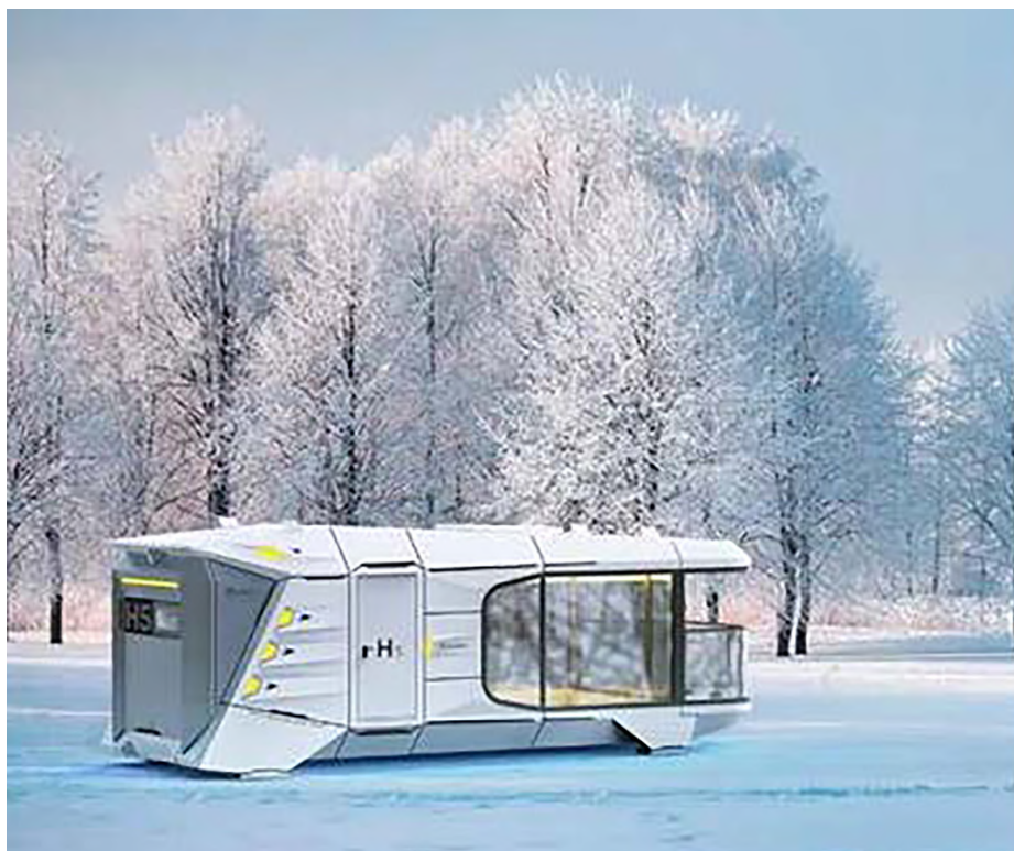
Рисунок 6. Перспективное изображение