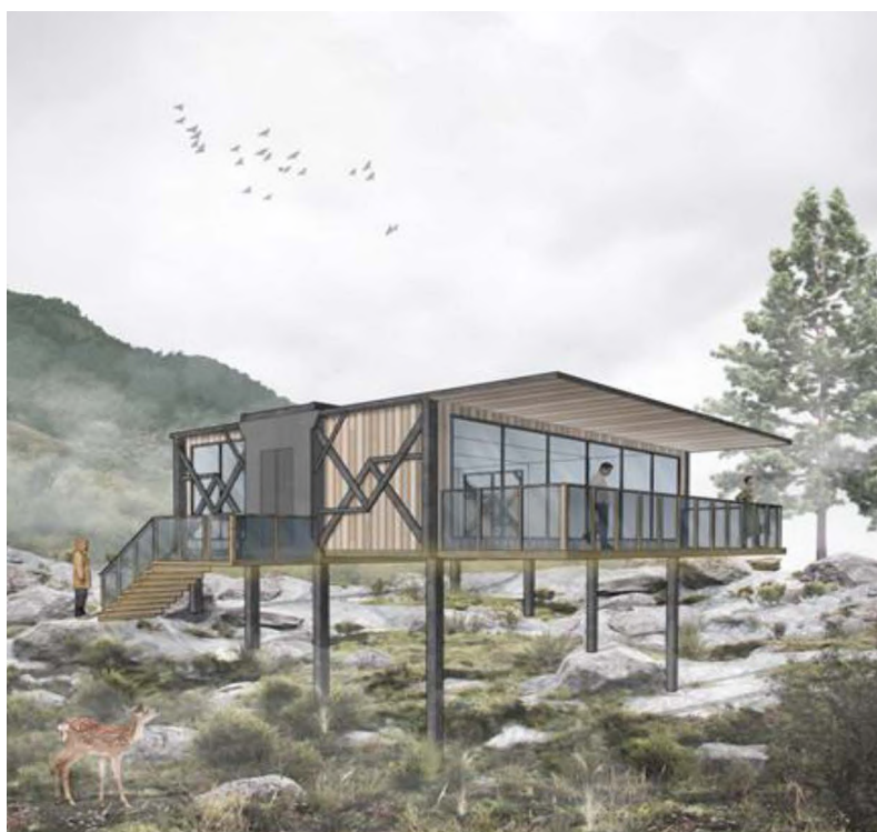
Рисунок 11. Перспективное изображение