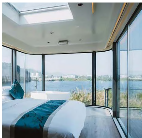
Рисунок 8. Интерьер