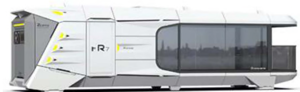
Рисунок 5. Перспективное изображение

мембрану, транспортируется и устанавливается на месте [8]. Каждый блок выполнен «под ключ» с установленной мебелью и сантехникой.