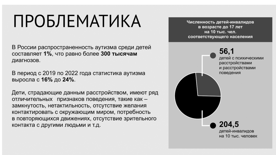
Рисунок 1. Данные состояния аутизма в России

В настоящее время показатель выявления у детей и взрослых расстройства аутистического спектра значительно возрастает с каждым годом. Только в 2019 году Министерство здравоохранения Российской Федерации сообщало о том, что число детей с диагнозом аутизм в России превысило 31 тысячу человек 1 , что представлено на рисунке 1.