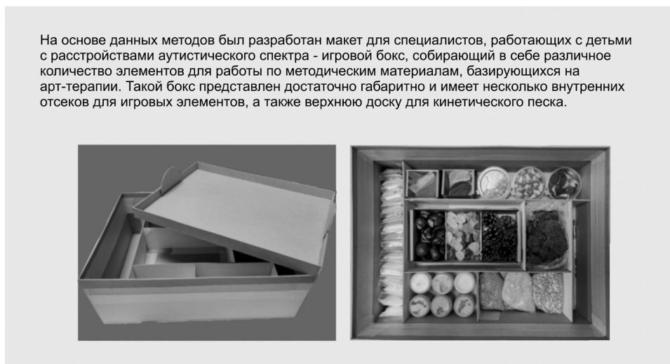
Рисунок 4. Проект макета нейро-бокса

добрать наиболее подходящие цветовые сочетания 4 , а также использовать графические элементы в виде паттернов или иллюстраций [1].